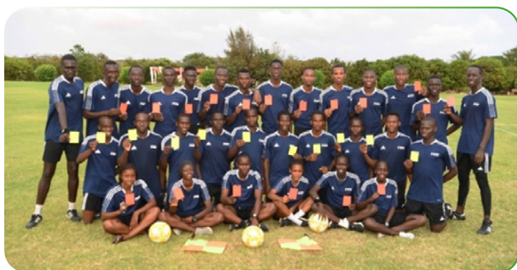
1. Cours FIFA arbitres Jeunes talentueux