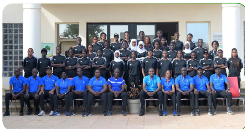
3. Cours FIFA arbitres Dames 2023